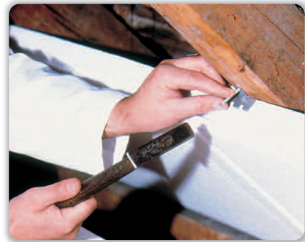
Befestigung der S-SPI-Platten mit IsoBouw-Dämmkrallen

Bei Dachgeschoßausbau zu Wohnzwecken muß nach DIN 4108 eine funktionssichere Dampfbremse und Luftdichtung hergestellt werden.